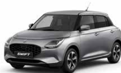
Premium Silver Metallic