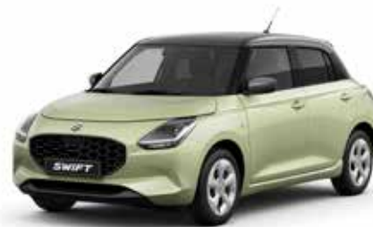
Cool Yellow Metallic & Mineral Gray Metallic***