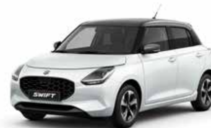
Pure White Pearl & Mineral Gray Metallic***