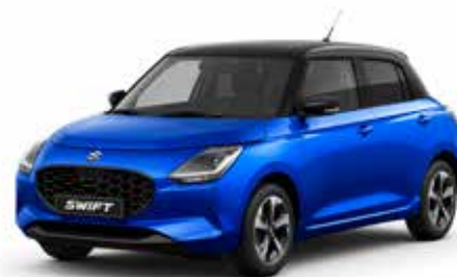
Frontier Blue Pearl Metallic & Super Black Pearl**