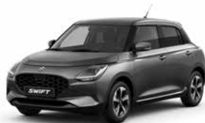
Mineral Gray Metallic