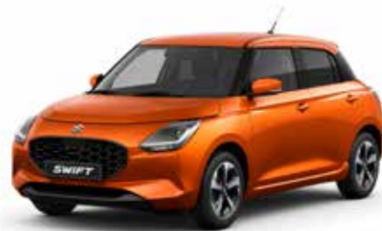
Flame Orange Pearl Metallic

De Suzuki Swift is leverbaar in verschillende kleuren, waaronder een aantal two-tone kleuren. Vind je het lastig om een goede kleur te kiezen? Kom dan langs in de showroom om de kleuren eens in het echt te bekijken, voordat je een beslissing neemt.