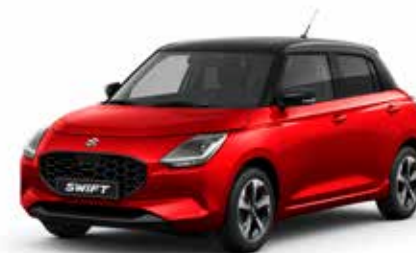
Burning Red Pearl Metallic & Super Black Pearl**