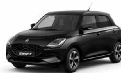
Super Black Pearl